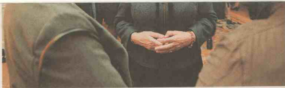
■英國政府將社企界定為私營及公營外的第三界別，官員甚至是皇室成員亦會不時與社企代表會面。

新法例規定福利企業必須以公眾，即持份者的利益為先，亦容許社企將資源集中於一個特定的公眾利益。 福利企業的法例除了監管社企的賬務及透明度外，法案中最重要的地方是，是它革命性地把企業持份者（包括員工、受眾，甚至整個社區）的利益合法化。