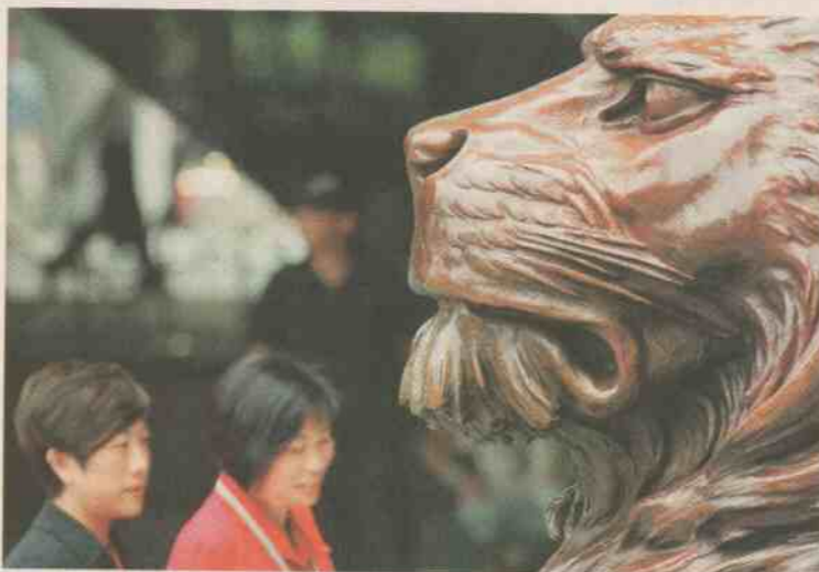
■社企對營商概念愈趨重視，「社聯——滙豐社會企業商務中心」設立的目的，就是為社企提供商業諮詢服務。（資料圖片）