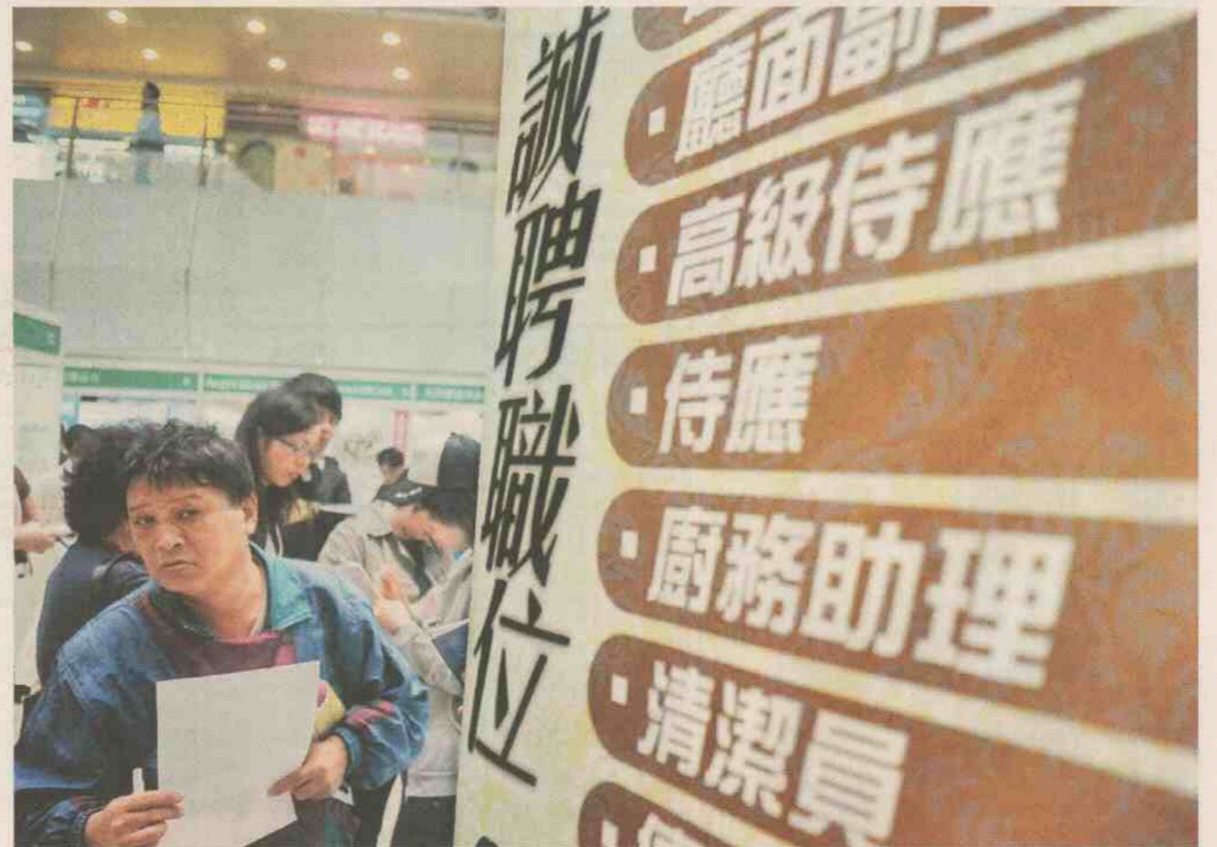
早期的社企以政府作主導，受惠層面狹窄，隨著時代變遷，社企也逐漸發展成由民間推動的運動。（資料圖片）

2001至2005年，政府為了要為殘障人士創造就業機會並援助弱勢社群，強調要「幫助他們加強自力更生的意志和能力」及「大力發揮社會基層人士的主動性」，先後成立了「創業展才能